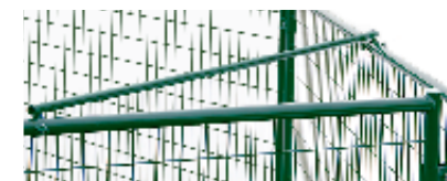
Iso tai monimutkainen tarha voidaan tukevoittaa lisävarusteena saatavilla Jämpti Pro Kulmatuilla.