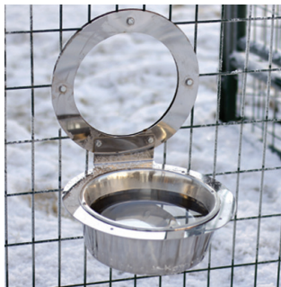
50045 | 50046